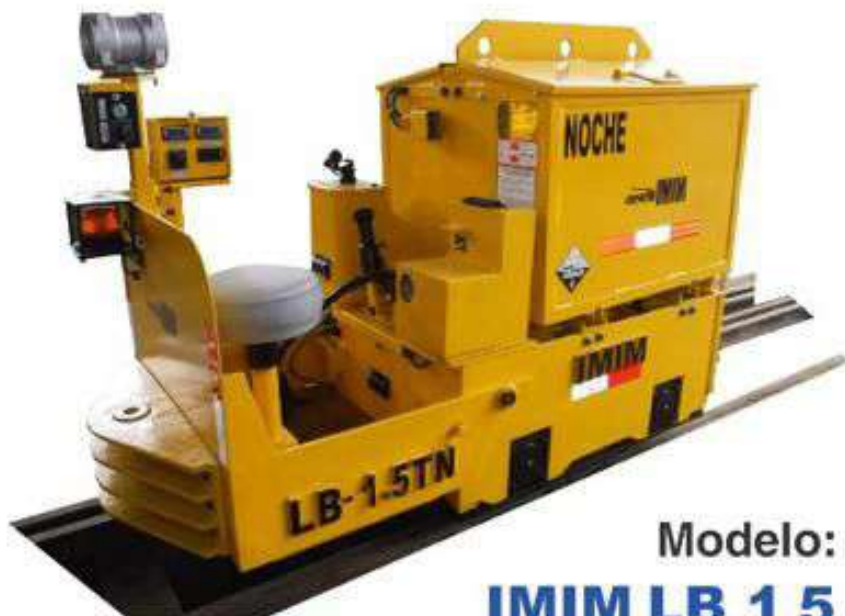
Modelo: IMIM LB 1.5 1.5 TN - 10HP